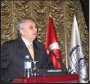
Tuğrul Kudatgobilik TİSK Başkanı