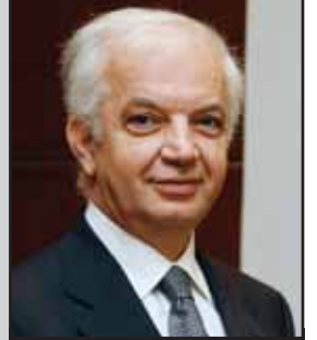
Celal Beysel TÜRKONFED Başkanı

Krizle birlikte hızla yükselen işsizliğin önüne geçilebilme için üretimi artırmanın yetmeyeceği, yapısal reformların gerektiği açıktır. İstihdam vergilerinin aşırı yük olması, istihdam kanunlarındaki aşırı rijitlik, asgari ücretin ve istihdam üzerindeki vergilerin ülkenin her köşesinde eşit olması, meslek eğitimine yeterince önem verilmemesi sonucu oluşan yapısal işsizlik, üzerine eğilinmesi gereken konulardır. Özellikle tarımda çalışan işgücünün sürekli azaldığı ve sanayi için becerili işgücünün oluşmadığı bu ortamda orta ve yüksek öğrenimle birlikte yaşam boyu öğrenim boyutunda da köklü bir mesleki eğitim reformu artık Türkiye için vazgeçilmez bir konu olarak karşımızda duruyor.