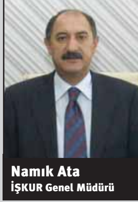
Namık Ata İŞKUR Genel Müdürü

Ülkemiz işgücü piyasasının temel yapısal sorunlarından birinin mevcut işgücü vasfının işgücü piyasasının ihtiyaçlarını karşılayamaması olduğunu biliyoruz. Firmalarımızın önemli bir kısmı kalifiye ara eleman sıkıntısı çektiğini belirtmektedir. Bu durumun iş piyasasını güncelliğini yakalayamayan mesleki eğitim sistemimizden ve eğitim-istihdam kopukluğundan kaynaklandığı da ayrı bir gerçektir. Bu yapısal uyumsuzluğun ancak çok etkin ve kapsamlı bir aktif istihdam tedbirleri sayesinde düzelmeye yoluna gireceği açıktır.