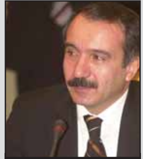
Ömer Dinçer Çalışma ve Sosyal Güvenlik Bakanı

Şunu hep beraber kabullenmeliyiz ki, bizim ülkemizde işsizlik çok müzminleşmiş bir sorundur ve yapısal boyutlarıyla daha çok öne çıkmaktadır. Krizle ilgili boyutlarına baktığımızda bunların toplumsal olarak üstesinden gelebileceğimizi görüyorum. Ama yapısal boyutlarıyla ilgili olarak sadece hükümetin çabalarıyla sorunu çözmek çok zor gibi görünüyor. İşgücü sektörüne yeni katılan nüfusa iş bulunmazsa işsizlik oranı yükselmeye devam edecek. Çünkü sektöre katılan insan sayısı yaratılan istihdamdan daha fazla. Genç nüfus çokluğu, mesleksizlik sorunu çözülmediği takdirde sorunları daha da ağırlaştıracak. Hızla insanlara meslek kazandıracak çabalara ağırlık verilmesi gerekir.