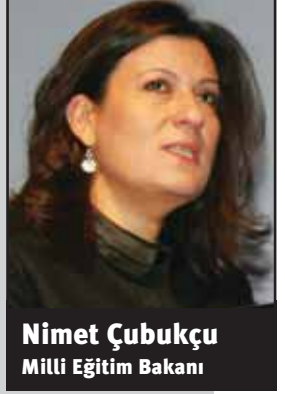
Nimet Çubukçu Milli Eğitim Bakanı

Mesleki ve teknik eğitim 2002-2003 yılında yüzde 28 iken, bugün yüzde 43 oranındadır. 2011 hedefimiz asgari yüzde 50’dir. Ama asıl hedefimiz, ortaöğretim çağ nüfusumuzun Avrupa Birliği ülkelerinde olduğu gibi yüzde 65 mesleki eğitim, yüzde 35 normal öğretim. İstihdam ve eğitim dengesini böyle oluşturmak istiyoruz.