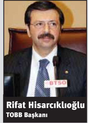
Rifat Hisarcıkloğlu TOBB Başkanı

Yoksulluk sınırının altında, açlık sınırında yaşayan insanlarımız var olduğu sürece olduğumuz yerde duramayız ve hiç bir şey yapmadan öylece oturamayız. Onun için yeni iş kapıları açmaya ihtiyacımız var. Bu insanlarımızı iş yaratmak ve aş vermek sorumluluğumuz var. Bunları gerçekleştirmek için kaynak da var, yetenek de. Asıl sorun bu kaynakları doğru kanallara harcama becerisinin gösterilmesi. Gençler iş talebi yaratmak yerine yeni iş alanları yaratarak istihdam yaratmaktadırlar. Bu önemsenmeli ve desteklenmeli. Zira ekonomimizin en büyük sorunu olan istihdam azlığı, gelir dengesinde ve toplumsal barışta sorunlar yaşamamıza neden olmaktadır.