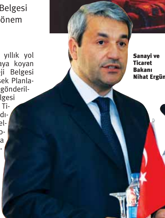
Sanayi ve Ticaret Bakanı Nihat Ergün

dirmesi, Bölgesel ve sektörel tercihler yaparak hem yatırımları planlaması ve kalkınmayı yayması, hem de kümelenmeyi şekillendirilmesi, ayrıca Ar-Ge ve inovasyona dönük odaklanmayı artırması, “yenilikçilik” ve “ihracata” yönelik destekleri düzenlemesi gibi yönleriyle önem taşıyor. Sanayi Strateji Belgesi, yatırımcı ve girişimci KOBİ’lerin kendi stratejilerini oluşturmasına da hizmet ediyor. Sanayi ve Tica-