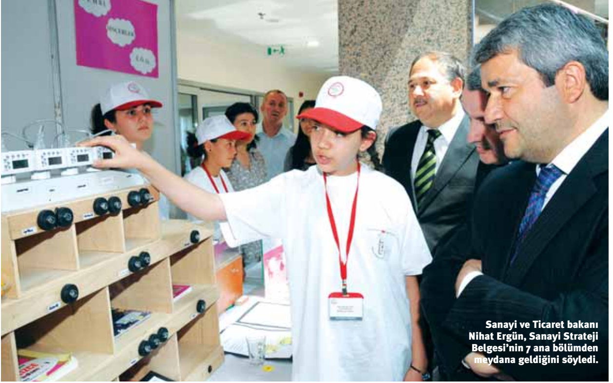
Sanayi ve Ticaret bakanı Nihat Ergün, Sanayi Strateji Belgesi'nin 7 ana bölümden meydana geldiğini söyledi.

dair gelişmeler ve gerçekleştirmeler sürekli olarak izlenerek, etkin uygulama için gerekli güncellemeler gerçekleştirilecektir.